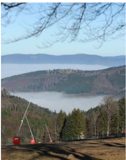
Grand bleu sur la piste de La Serva, hier : de quoi effectuer de belles balades, ce week-end encore.