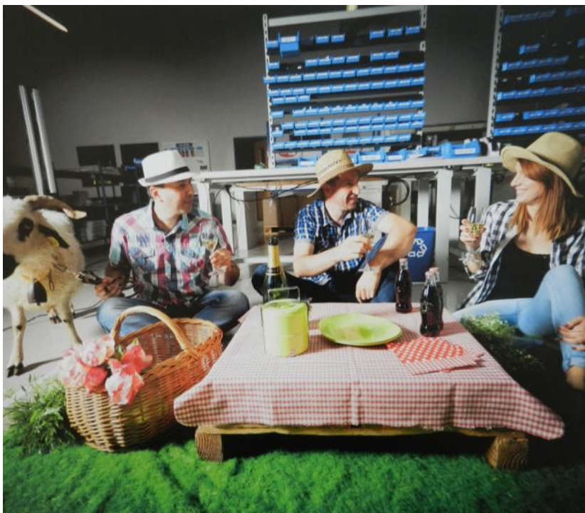
C'est le joli mois de mai dans les ateliers.

Janvier a son skieur sur établi. En février, on fait des crêpes sur la ligne de montage. En avril, un lapin fait la sieste sur les palettes, en mai, on pique-nique en logistique, en août, le patron lui-même a monté la piscine en plastique dans son bureau... Une réalisation avec les salariés volontaires sur des idées de l'agence de communication Cactus et les photos de la photographe Marie Soehnlen.